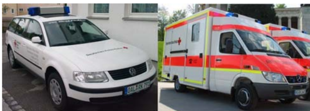
Helfer vor Ort

Wir sehen hier zwei Rettungsfahrzeuge. Was meint ihr, welches davon von wem finanziert wird? Ihr werdet überrascht sein!